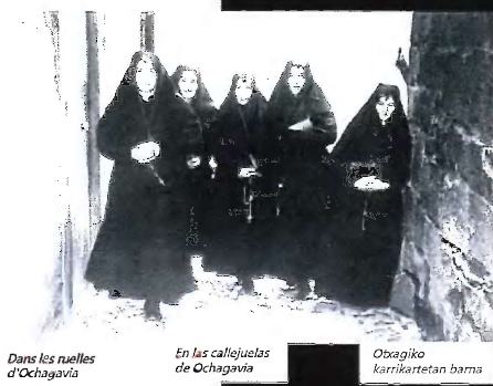
Dans les ruelles d'Ochagavía En las callejuelas de Ochagavía Obagiko kartikartetan bama