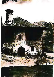
Maison traditionnelle d'Isaba Casa tradicional d'Isaba