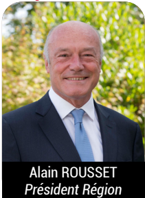
Alain ROUSSET Président Région

La CTJ est un moment unique où acteurs et usagers de services publics échangent sur leurs problématiques pour trouver ensemble les solutions de demain.