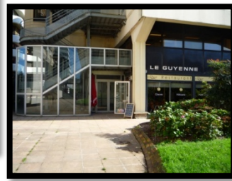
Restaurant Le Guyenne