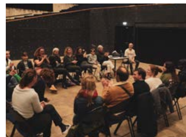
Salle des fêtes - Festival Têtes d'Oranges, Glob Theatre