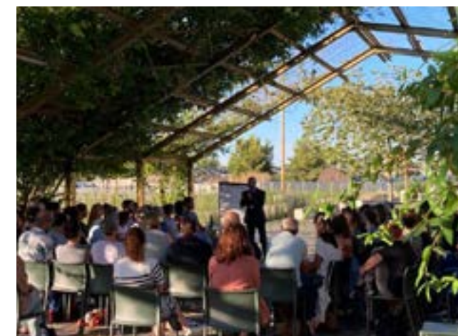
En plein air, sur le parvis des archives de Bordeaux Métropole