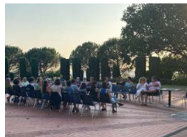
En plein air - Commune de Cenon, Château Tranchère