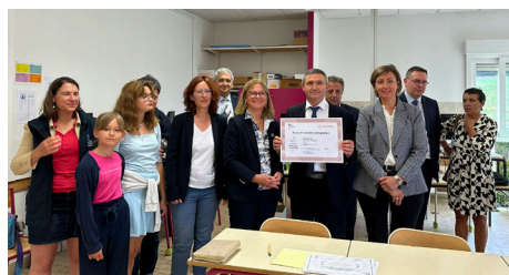
Remise de l'attestation de financement du projet par la rectrice en juin 2023