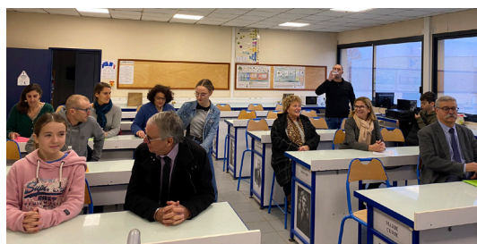
Réunion de concertation et de présentation du projet en décembre 2022.